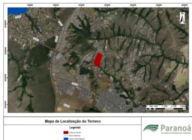
Figura 1: Mapa de localização do Terreno

O INSTITUTO DE MEIO AMBIENTE E DOS RECURSOS HÍDRICOS DO DISTRITO FEDERAL - BRASILIA AMBIENTAL - IBRAM/DF - convida todos os interessados para a Audiência Pública VIRTUAL/PRESENCIAL de apresentação e discussão do RELATÓRIO DE IMPACTO DE VIZINHANÇA – RIVI para PARCELAMENTO DE SOLO URBANO, referente ao licenciamento ambiental (LICENÇA PRÉVIA - LP) do empreendimento denominado Parcelamento de Solo Urbano - VILLA BORGHESE RESIDENCIAL & RESORTS, localiza-se à Estrada do Sol km 7, Quinhão 11 da Fazenda Taboquinha, no Setor Habitacional Jardim Botânico, Região Administrativa do Jardim Botânico (RA XXVII), Distrito Federal. INTERESSADO: União Desenvolvimento Imobiliário S/A. Processo SEI 00391-00012926/2017-10. Visando uma maior participação, a Audiência Pública será realizada de forma VIRTUAL E PRESENCIAL, com transmissão ao vivo, no dia 06 DE MARÇO DE 2024, com início às 19h00min e encerramento previsto para às 22h00min. As instruções relativas aos canais de transmissão e respectivos procedimentos para acesso e participação serão divulgadas previamente, no prazo mínimo de 5 (cinco) dias de antecedência da data de realização da audiência pública, no endereço eletrônico www.ibram.df.gov.br e ficarão disponíveis até o encerramento da Audiência Pública. Os estudos, regulamento da audiência e demais documentação poderão ser acessados por meio do endereço eletrônico www.ibram.df.gov.br .