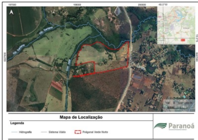
Figura 1: Mapa de Localização do Parcelamento Verde Veredas. Fonte: Paranoá Consult - RIVI (136161439).

O INSTITUTO DO MEIO AMBIENTE E DOS RECURSOS HÍDRICOS DO DISTRITO FEDERAL - BRASÍLIA AMBIENTAL, convida todos os interessados para a Audiência Pública VIRTUAL/PRESENCIAL de apresentação e discussão do Relatório de Impacto de Vizinhança - RIVI para PARCELAMENTO DE SOLO URBANO, referente ao licenciamento ambiental (LICENÇA PRÉVIA - LP) do empreendimento denominado Parcelamento de Solo Urbano - VERDE VEREDAS, localizado à margem da DF-140, localizado na Região Administrativa do Jardim Botânico no Distrito Federal. INTERESSADO: VERDE URBANISMO PARTICIPAÇÕES LTDA. Processo de Licenciamento Ambiental nº SEI 00391-00002892/2023-95. Visando uma maior participação, a Audiência Pública será realizada de forma VIRTUAL E PRESENCIAL, com transmissão ao vivo, no dia 13 de agosto de 2024, com início às 19h00min e encerramento previsto para às 22h00min. As instruções relativas aos canais de transmissão e respectivos procedimentos para acesso e participação serão divulgadas previamente, no prazo mínimo de 5 (cinco) dias de antecedência da data de realização da audiência pública, no endereço eletrônico www.ibram.df.gov.br e ficarão disponíveis até o encerramento da Audiência Pública. Os estudos, regulamento da audiência e demais documentação poderão ser acessados por meio do endereço eletrônico www.ibram.df.gov.br .